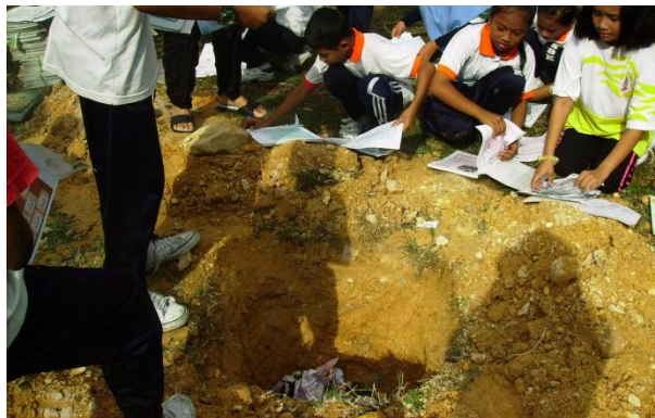
Pelupusan secara tanam