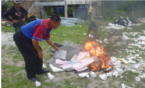
Pelupusan secara pembakaran